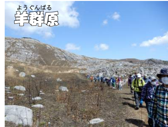
ようぐんばる 羊群原

野焼き後の草の無い、今の時期にしか通る事の出来ない道をハイキングしました。野草はまだ探さないと見つからない状態でしたが、晴天の奇岩の並ぶ絶景を見ながら歩く事が出来ました。