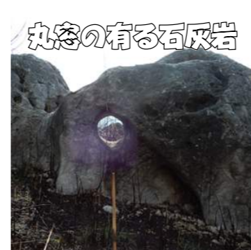
丸窓の有る石灰岩