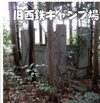
旧西鉄キャンプ場