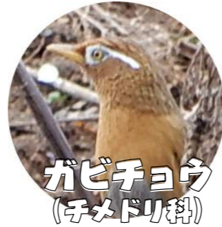
ガビチョウ (チメドリ科)

今年は広谷(湿原)に火が入ってしまい、地形などがはっきりとわかる状態になりました。過去には広谷も野焼きをしていました。